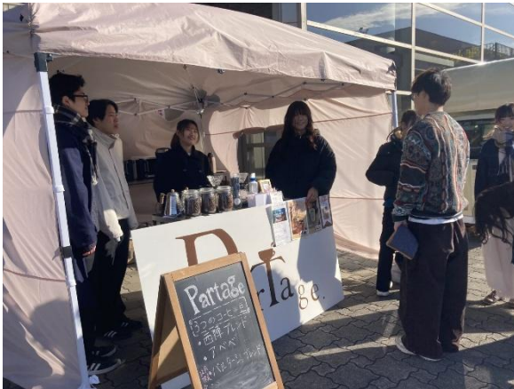
カフェプロジェクト