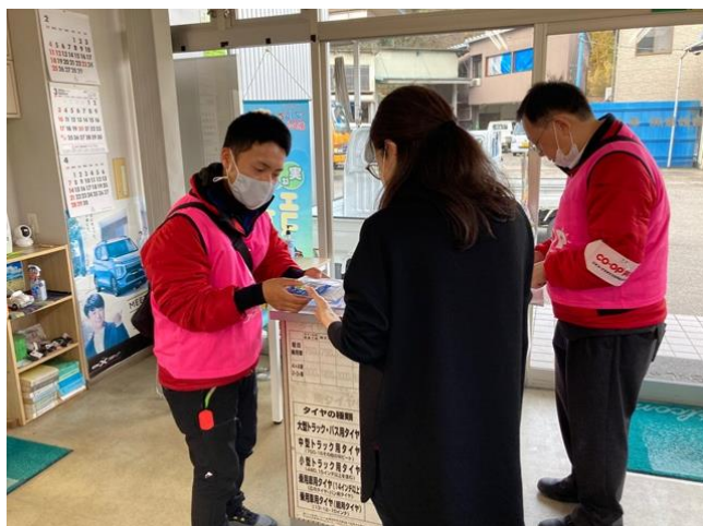
穴水町の避難所への訪問の様子