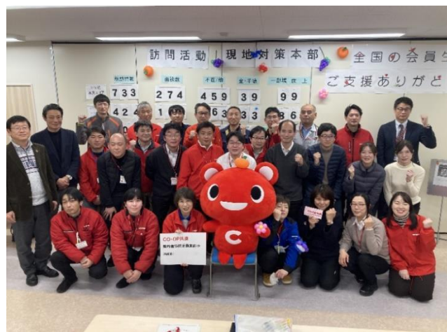
訪問活動メンバー