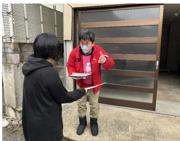
組合員宅への訪問活動の様子