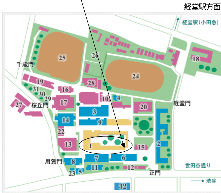
農大前バス停方面